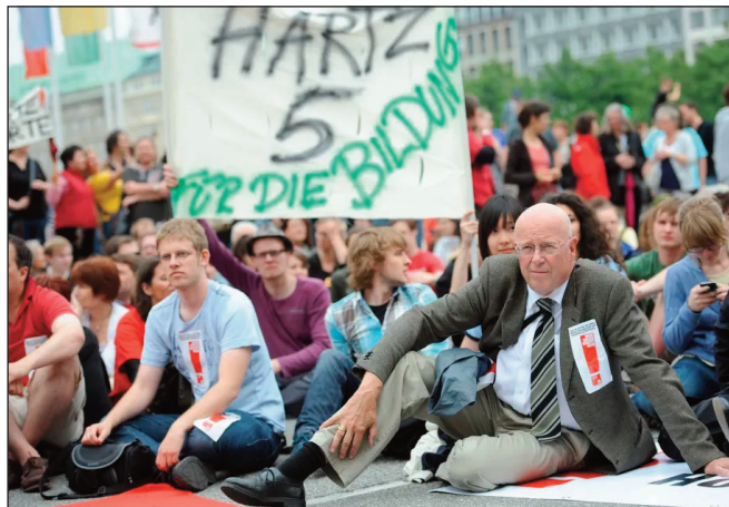
Studierende, Lehrende und Verwaltung gemeinsam auf der Straße (7. Juni 2011)

Diese Erhöhungen wurden jedoch vom Dogmatismus der Schuldenbremse schnell aufgefressen und im Jahr 2014 griffen die Hochschulen den „Kampf um die Zukunft“ wieder auf. Noch offensiver als bei den vorherigen Protesten begründete die Uni die Notwendigkeit einer auskömmlichen Finanzierung mit der gesellschaftlichen Bedeutung von Forschung, Lehre und Bildung. Beispielgebend